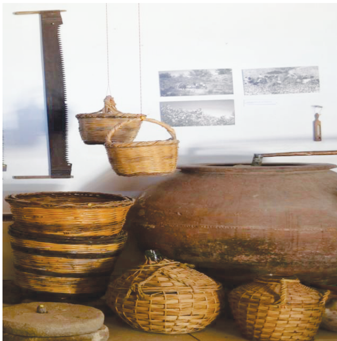
Κοφίνια, καλάθια και Λαμιτζάνες από το Λαογραφικό Μουσείο στον Πεδουλιά