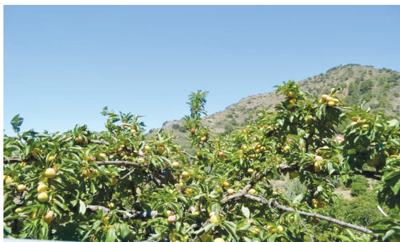
Μηλιές από τη Μαραθάσα