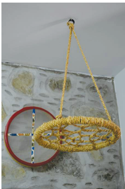
«Κόσκινο αρκό» από ιδιωτική συλλογή στις Τρεις Ελιές