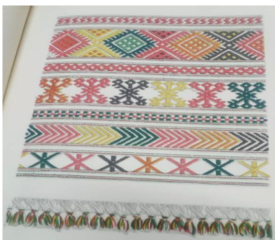
«Πλούμιά της βούφας» ή «κοτσινοπλούμια»