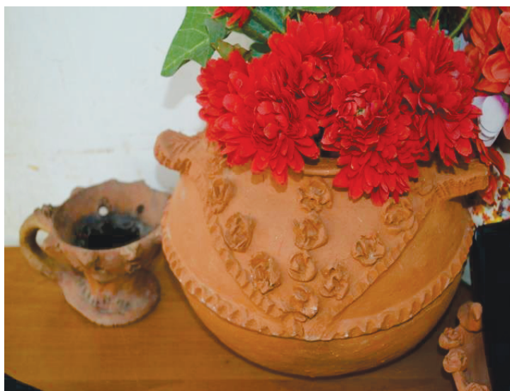
Καπνιστήρι και διακοσμητικό αγγείο από ιδιωτική Συλλογή στο χωριό Άγιος Δημήτριος