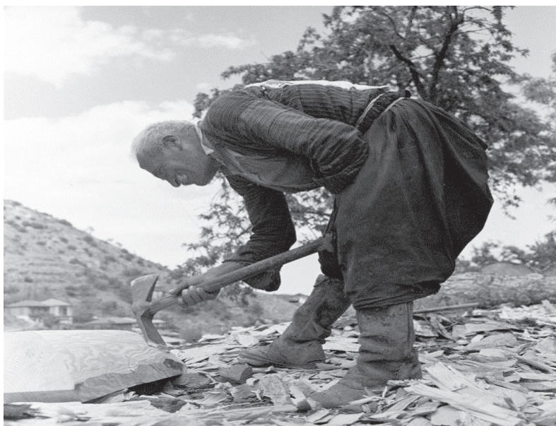
Ξυλογλύπτης στον Μουτουιλλιά