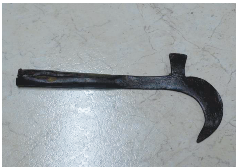
Κλαδευτήρι αμπελιού από το Λαογραφικό Μουσείο στα Καμινάρια