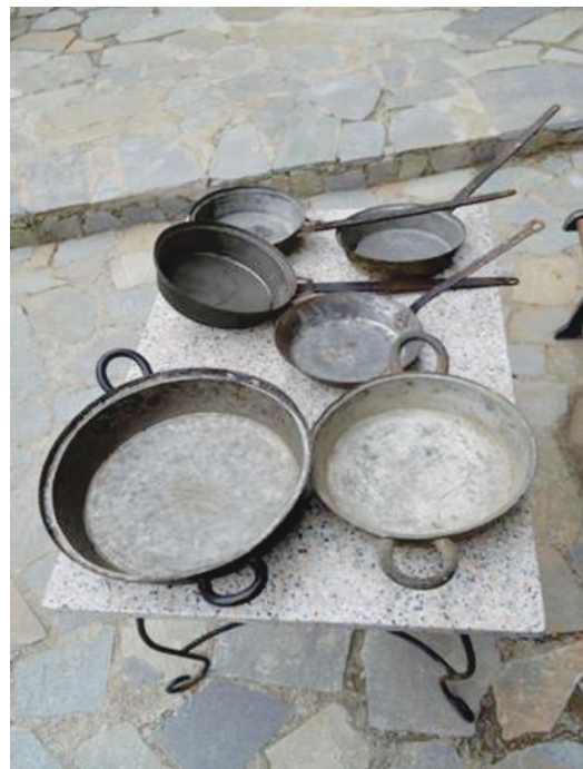
Διάφορα μαγειρικά σκεύη όπως «μαεΐρισσες», «τηάνια», από ιδιωτική Συλλογή στο χωριό Τρεις Ελιές