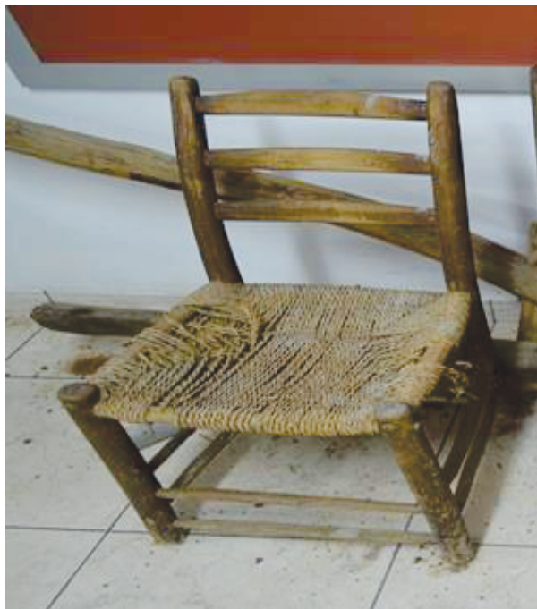
Τορνεφτή Τσαέρα από το Μουσείο στα Καμινάρια