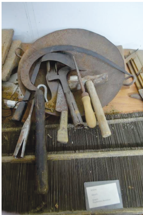
Μεταλλικά γεωργικά εργαλεία από το Λαογραφικό Μουσείο Καμιναριών