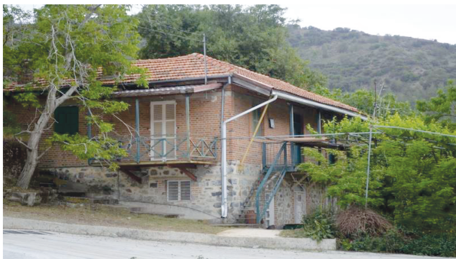
Σπίτι στον Άγιο Δημήτριο με ξύλινο μπαλκόνι που συνδέεται με το ισόγειο με μια ξύλινη σκάλα.