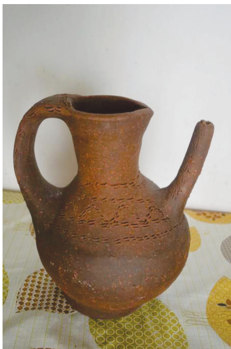
Κορύπα από ιδιωτική Συλλογή στο χωριό Καμίνια